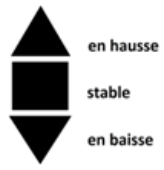
Figure 2 : Symbole représentant la tendance de l'évolution du niveau piézométrique par rapport au mois précédent

NSm max : niveau moyen maximal de la série